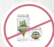
ENVASES DE VIDRIO